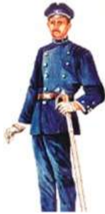
Polícia Cívica - Farda de Gala - 1898