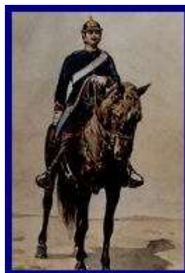
Oficial da Guarda Municipal Cavalaria - 1900

Fundou ainda a Guarda Real de Polícia em 25 de Dezembro de 1801, um corpo militarizado a cavalo, e iluminou a cidade de Lisboa, o que obviou muito à criminalidade. Criou casas de correção e a Polícia Sanitária para as prostitutas.