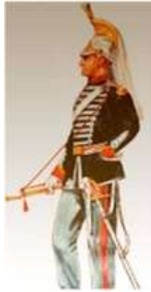
Policia Municipal - Clarim - 1882