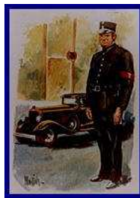
Polícia Sinaleiro - 1942 a 1948