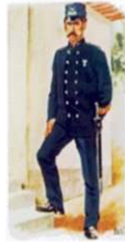
Polícia Cívica - 1898

Esta Lei foi antecedida de um relatório elaborado por uma comissão de juristas, no qual, a determinado passo se pode ler: “A segurança pública é condição essencial para a existência de toda a sociedade bem organizada, e por isso, com razão, já se escreveu: que ela é para o corpo social o que o ar é para o corpo humano. À Polícia cumpre fazer cessar toda a perturbação na economia da sociedade organizada e constituída: a sua actividade é de todas as horas. (...). Os agentes da Polícia devem ser indivíduos que pela sua moralidade, honestidade e prudência, chamem sobre si as simpatias do público para que este, pelo seu lado, fazendo justiça aos seus esforços, nunca lhes negue o seu apoio” .