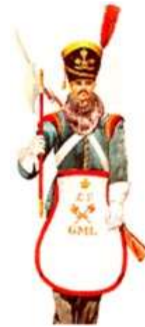
Policia Municipal - Porta Machado - 1882

Em período de grande confusão política e social resultante das lutas entre liberais e absolutistas, é suprimida a Guarda Real de Polícia e substituída pela Guarda Municipal. (atualmente representada pela Guarda Nacional Republicana, uma polícia militar que atua no domínio civil), e criada por Pereira do Carmo.