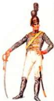
Guarda Real de Policia - 1808

são presos e bairros suspeitos de Lisboa, como Alfama, Mouraria, Bairro Alto e Madragoa, são limpos de muitos marginais. Reorganizando os serviços, impõe o respeito da população ao Departamento.