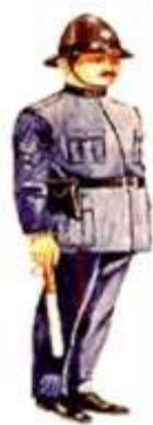
Sinaleiro - 1949