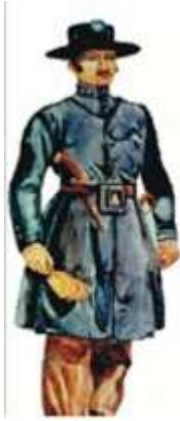
Guarda Municipal - 1834