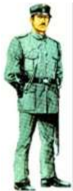
Patrulheiro - 1949 a 1958

Atualmente o Instituto Superior de Ciências Policiais e Segurança Interna, é responsável pela formação de todos os novos oficiais da PSP, pela capacitação dos atuais oficiais de polícia, assim como forma dirigentes e oficiais de polícia de outros países de língua Portuguesa, ministrando academicamente o grau de Mestrado.