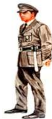
Patrulheiro - 1959