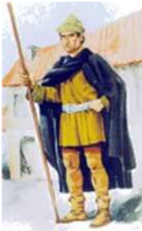
QUADRILHEIRO o primeiro polícia da língua portuguesa

POLÍCIA - “Instituição encarregada de manter a ordem e a segurança públicas e de velar pelo cumprimento das leis relativas a essa ordem e segurança, na multiplicidade dos seus aspectos.” in “Grande Enciclopédia Portuguesa e Brasileira”